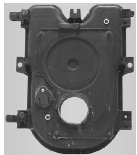
Abb./Fig. 2: Kesseltür nach erfolgter Brennerdemontage Porte de la chaudière après démontage du brûleur existant Porta della caldaia dopo lo smontaggio del bruciatore

➔ Demontieren Sie den vorhandenen Brenner komplett.