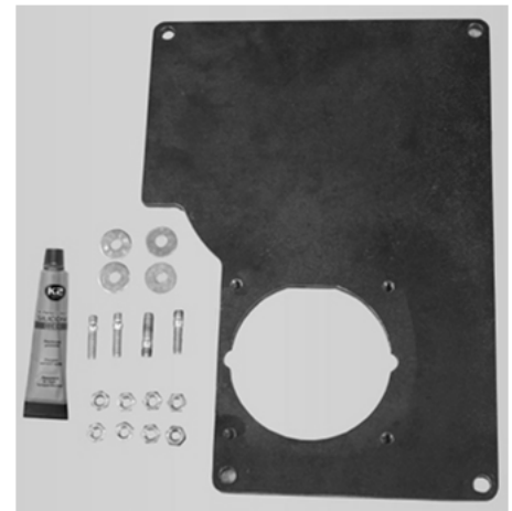
Abb./Fig. 1: Lieferumfang Brenner-Adapter-Set Contenu de la livraison du set d'adaptation brûleur Fornitura set adattatore bruciatore