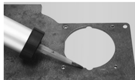
Abb./Fig. 3: Auftragen des K2 Hochtemperatur-Silikons Application du silicone haute température K2 Applicazione del silicone ad alte temperature K2