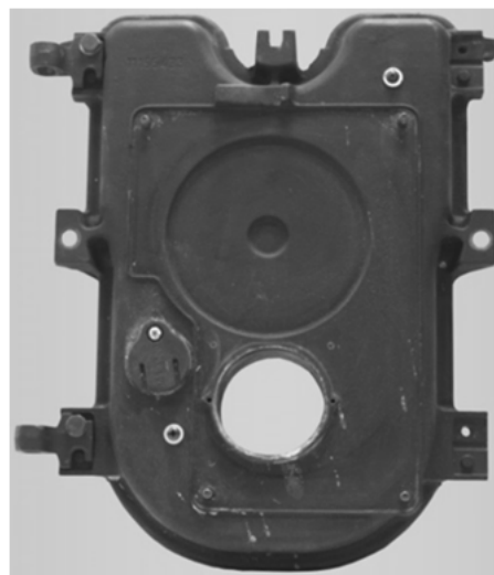
Abb./Fig. 2: Porte de la chaudière après démontage du brûleur existant Porta della caldaia dopo lo smontaggio del bruciatore

➔ Démontez complètement le brûleur existant.